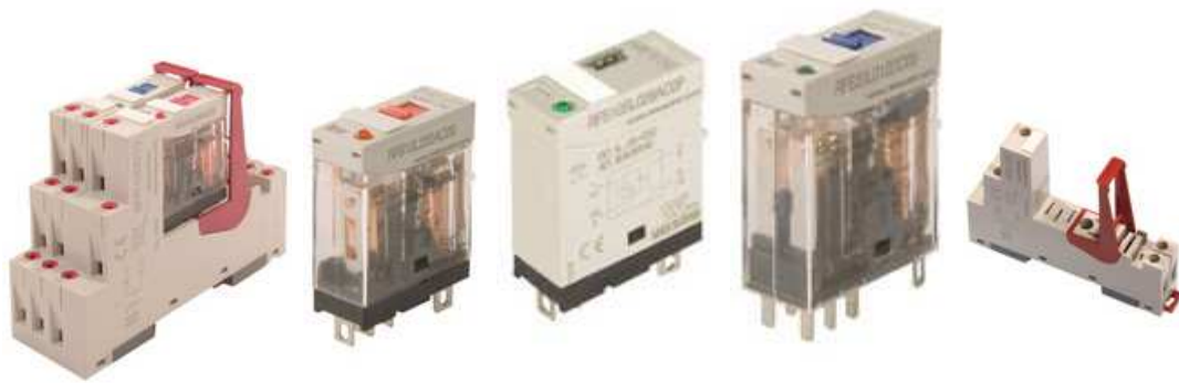
RELÉ INTERFAZ DE 1 CONTACTO INV, 1 CONTACTO NO, Ó 2 CONTACTOS INVERSORES