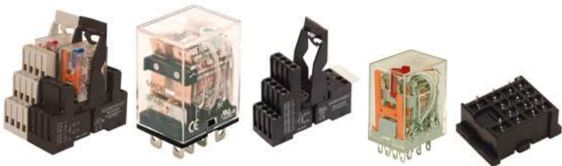
RELÉ MINIATURA DE 1, 2 Ó 4 CONTACTOS INVERSORES