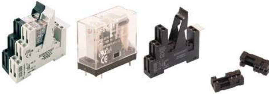
RELÉ INTERFAZ DE 1 Ó 2 CONTACTOS INVERSORES