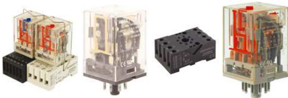
RELÉ INDUSTRIAL 2 Ó 3 CONTACTOS